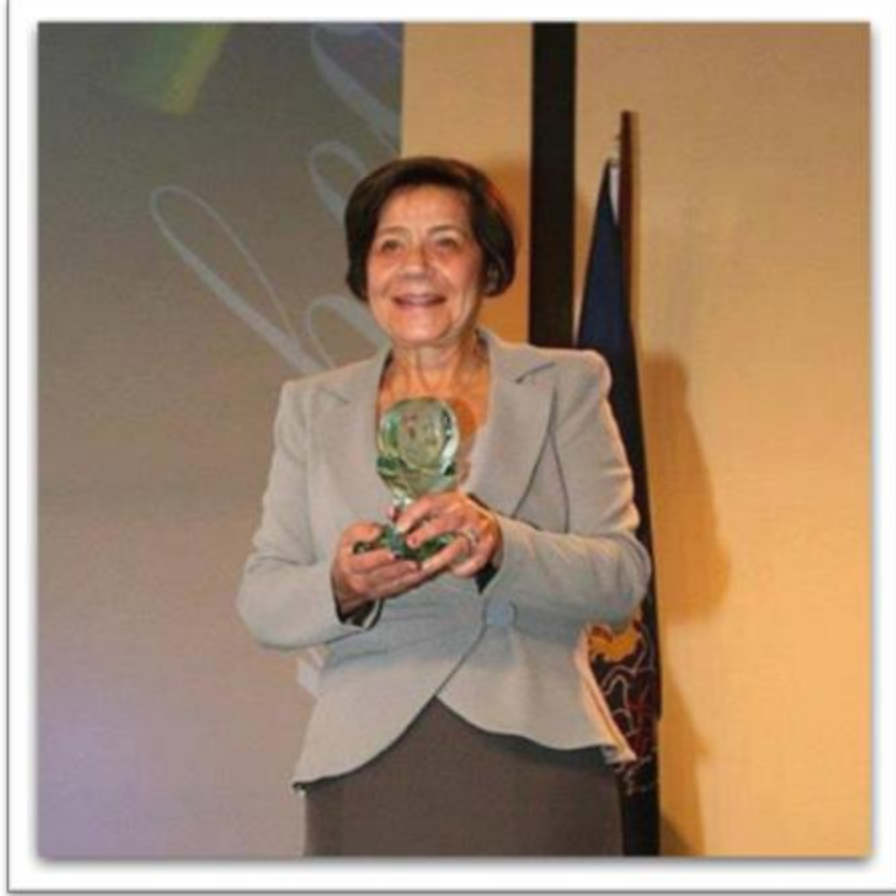
لولا زقلمة – Loula Zakalama

In 1962, Zakalama established the first private advertising company in Egypt. She was ranked number 48 among the 200 most powerful Arab women on Forbes list in 2014, and was honored as one of the 50 women who influenced the Egyptian economy in 2015.