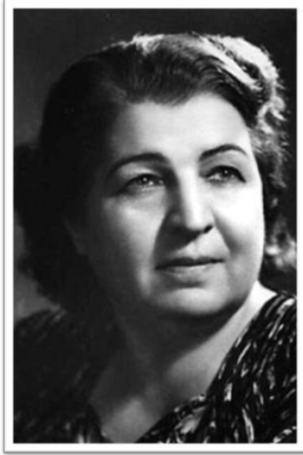
روز اليوسف – Rose El Youssef (1898-1958)

One of the renowned stars of Egyptian theatre at the turn of the century; Rose El Youssef published a weekly magazine in 1925, which initially started as an art magazine. The publication soon launched into politics and social criticism. Rose Al-Youssef magazine remains one of the most popular and widely circulated weeklies.