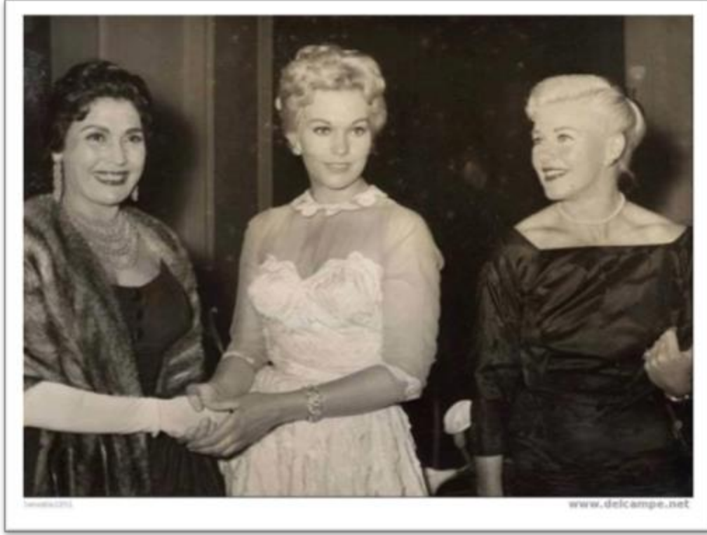
تحية كاريوكا – Taheya Carioca (1915-1999)

Actress and belly dancer Taheya Carioca was described by Edward Said, professor of literature at Columbia University, as “not only a belly dancer, but an artist who played a role in shaping Egypt’s modern culture.” In 1956, Taheya Carioca’s movie Shabab Imraat (Youth of a Woman) was screened at the Cannes Film Festival. Taheya is seen in the photo with actresses Kim Novak with Susan Hayward at the festival.