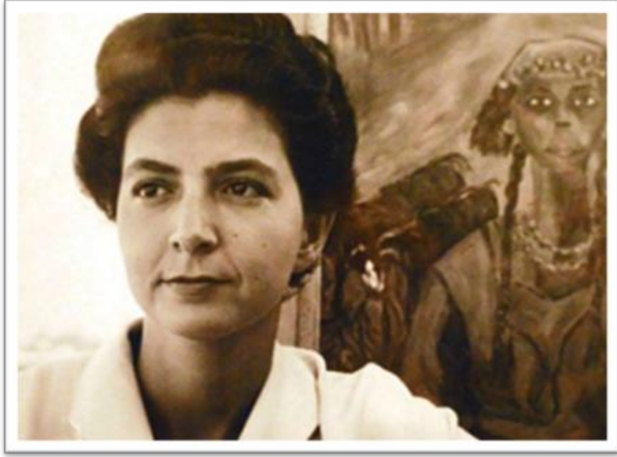
انجي أفلاطون – Inji Aflaton (1924 – 1989)

Efflatoun was a feminist and political activist as well as an artist. At the beginning of the 1940's, she was one of the first women to attend the Faculty of Arts at Cairo University. In 1950, Efflatoun joined the Youth Committee of the Egyptian Feminist Union. In 1951, and together with other female activists in the organization they organized the Women's Committee for Popular Resistance, to coordinate women's efforts in the resistance movement against the British