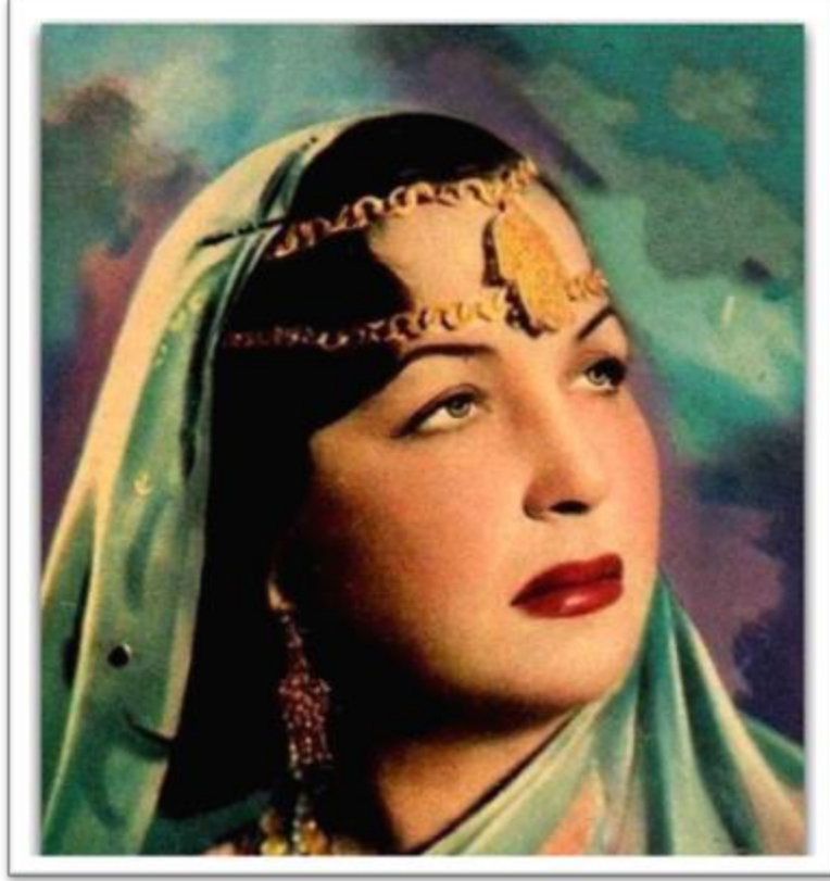
فاطمة رشدي - Fatma Roushdy (1908 – 1996)

An iconic figure in Egyptian theater and film in the 1920s and 1930s, Roushdy became known as “Sarah Bernhardt of the East.” She co-founded a movie production company and became famous in cinema for her leading role in the 1939 film Determination .