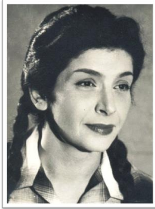
سناة جميل - Sanaa Gamil (1930 – 2002)

One of the best Egyptian theater actresses, Sanaa Gamil played a number of roles on the French Stage for La Comedie Francaise. In 1961, she won best supporting actress award at the Moscow Film Festival for her role in the movie Bidaya wa Nihaya (A Beginning and an End) based on a novel by Nobel Prize winner Naguib Mahfouz. Omar Sharif played the leading role.