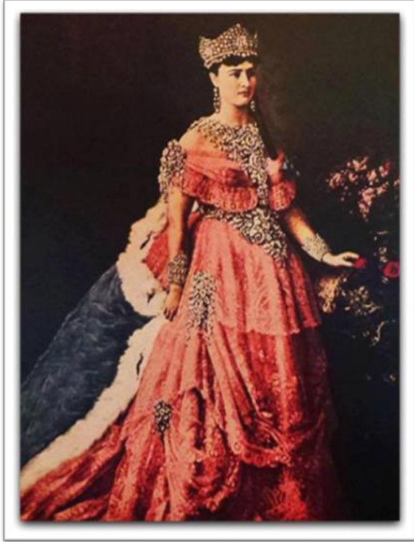
Princess Fatma Ismail - الأميرة فاطمة إسماعيل (1853 – 1920)

In 1914 Princess Fatma, daughter of Khedeive Ismail, donated all her jewelry for the construction of Fouad I University. She then endowed the revenue from 658 acres of her land to be spent on the university.