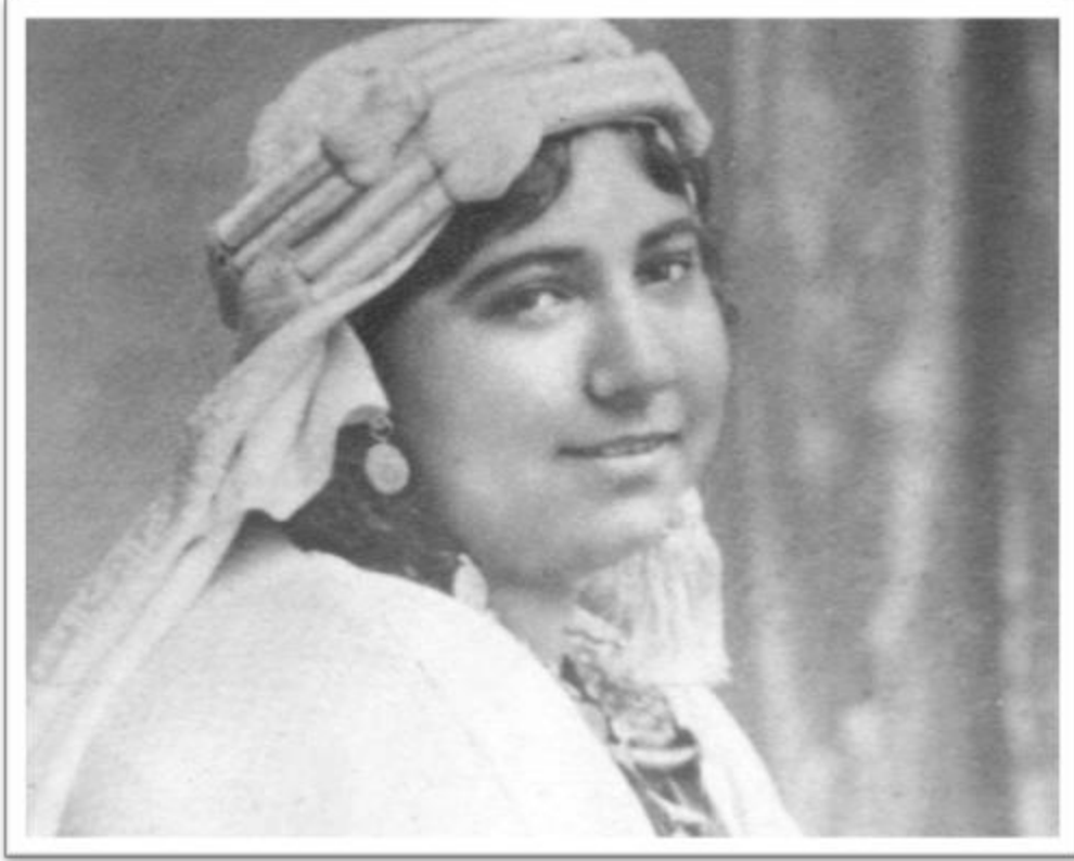
ملك حفني ناصف - Malak Hefni Nasif (1886 – 1918)

Malak Hefny Nassef, a.k.a Bahethat Al Badey (Desert Researcher) was a writer, an advocate for social reform and a pioneer suffragist in the early 20th century. She was the first Egyptian woman to publicly call for the liberation of women. At the Nationalist Congress in 1911, she issued the first set of feminist demands, which included women's right to education and work.