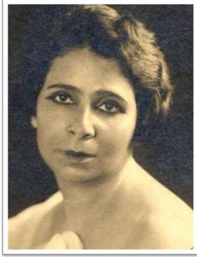
دولت أبيض - Dawlat Abiad (1894 –1978 )

Dawlat Abyad was a pioneer theatrical actress. In 1917, at the age of twenty-three, she played the role of Queen Jocasta in Oedipus Fell . In the cinema, she played a part in Zeinab , the first Egyptian silence movie produced in 1930.