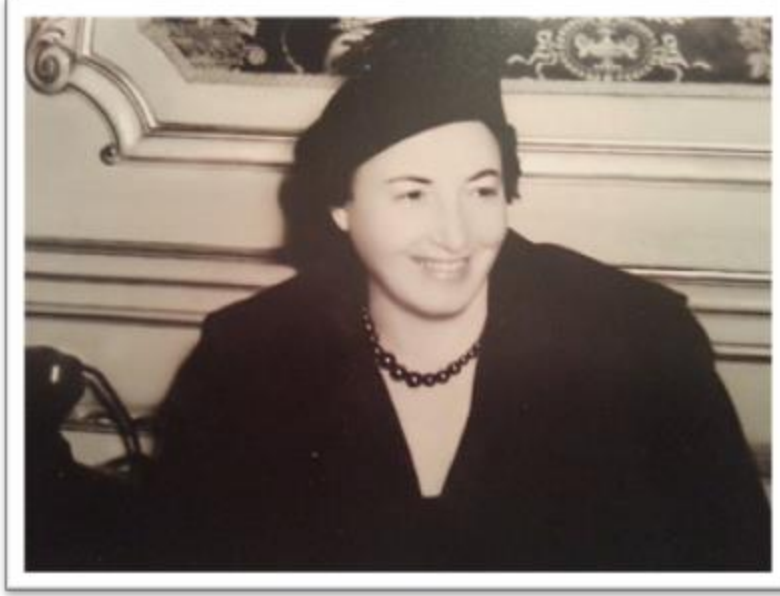
أسماء فهمي – Asmaa Fahmi (1906-1956)

A leader in the Egyptian Suffragette Movement and an advocate for girl's education, Fahmi received her BA in history and her MA in educational psychology from the University of London in 1937. She donated the land of the first girls' collage, to encourage conservative families to send their daughters for higher education. She was the first female member of the board of Ain Shams University and the VP of "Daughter of the Nile" party, founded and headed by Doreya Shafik. She was among the first women who fought for women's right to vote.