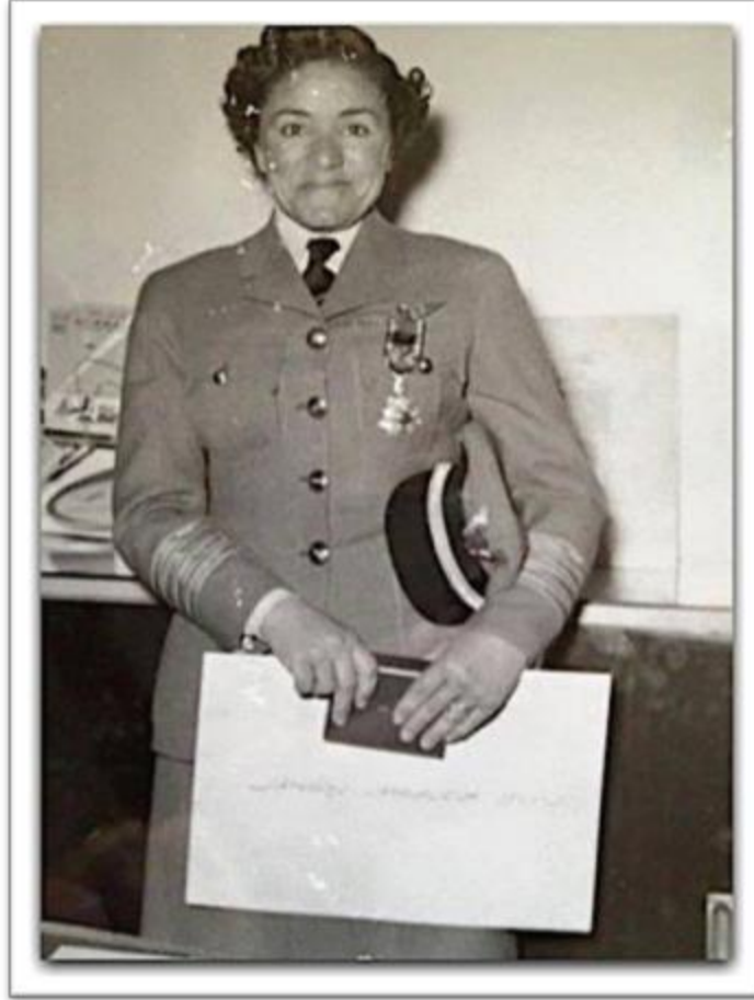
عزيزة محرم – Aziza Moharam (1919 – 1997)

Captain Moharam studied aviation in 1935 and became a flying instructor. After 22,000 hours of flying, she was qualified to become the first Egyptian female chief flying instructor. In 1967, she became the first female managing director of a civil aviation institute in the world.