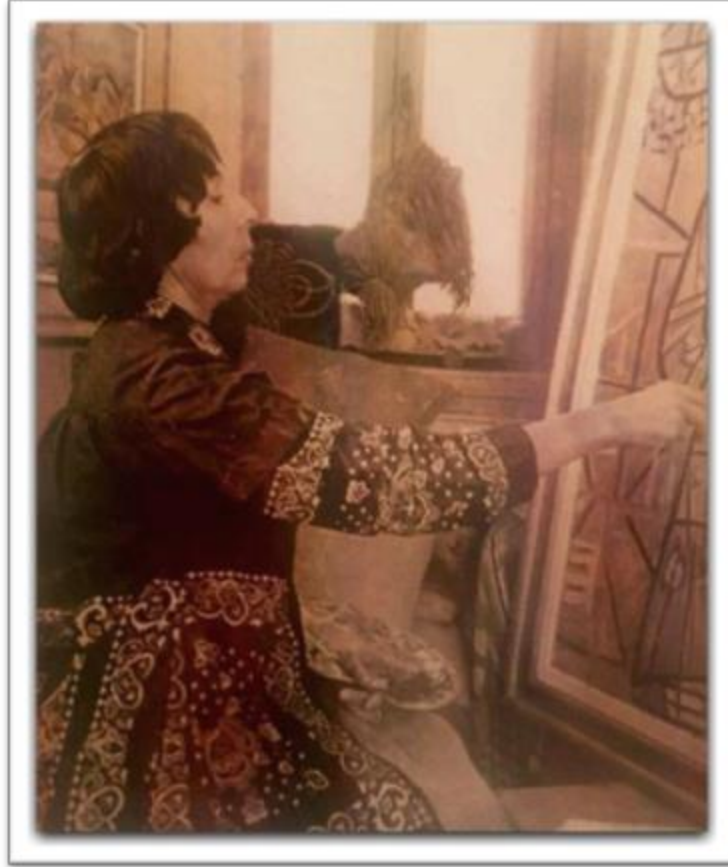
عفت ناجي – Effat Nagi (1905-1994)

A distinguished artist whose art is sold in galleries and auctions worldwide. She studied fresco and mural paintings in Rome, Italy, from 1947 to 1950. Nagi was the first artist whose works were housed in the Museum of Modern Art in Cairo in 1928. After her death, her house in Cairo was transformed into one of the most important art museums of Cairo.