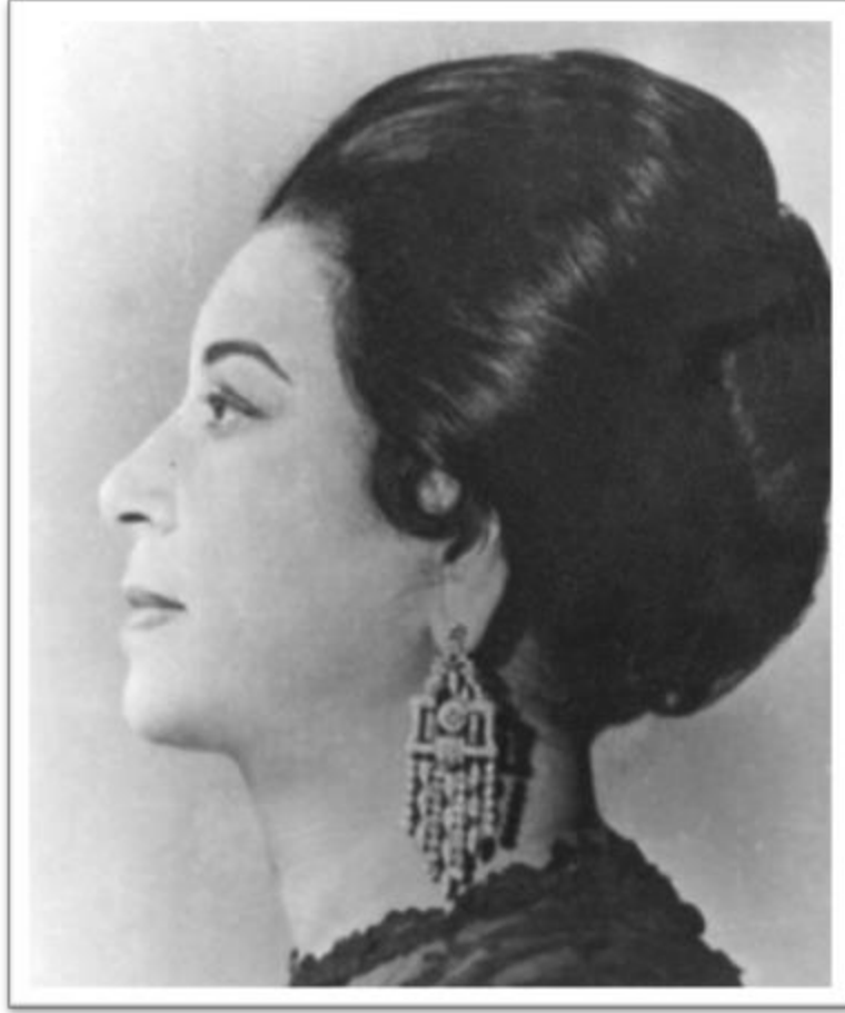
أم كلثوم – Om Kolthom (1975 – ??)

The Egyptian Diva was not only the first woman to become the president of the musicians' syndicate, but it was also her idea. In 1942, after winning the election against musician and singer Mohamed Abdel Wahab, she headed the syndicate of musicians for 7 years.