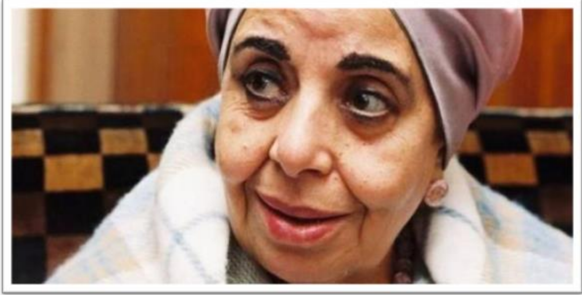
نعمات أحمد فؤاد - Nemat Ahmed Fouad (1926 – 2016)

The prominent writer and author, Nemat Fouad, a.k.a. Daughter of the Nile, was the first female student to rank number one in the national high school exams. She received her PhD in Arabic literature in 1959. Fouad authored many books, among which are “Om Kulthum and the Nile” and “To My Daughter”, which was translated to English by the UNESCO.